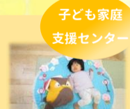
子ども家庭支援センター

男の子も女の子もみんなあ〜つまれ! ひなまっぴりのつどいを開催しました。たくさんのお友だちが歌をうたってひなまっぴりを楽しみました。ひなまっぴり製作をしてフォトコーナーで写真を撮って、とても楽しそうな親子の笑顔が見られました。