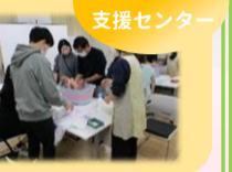
子ども家庭支援センター

プレママ・プレパパ限定で助産師さんによる沐浴体験を開催しました。体験後には先輩ママから体験談を話していただきました。コロナ禍の影響もあり、まだ沐浴体験ができる場所が少ないようで、参加された方には好評でした。