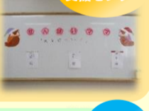
子ども家庭支援センター

保育園入園を考えている方に向けて、保育園に通う先輩ママをお呼びし、お話を頂きました。先輩ママには、参加した方からの質問にも答えていただき、時折笑顔も見られながらの楽しい時間となりました。