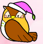
こどもプラザキャラクター「ふくちゃん」