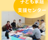
子ども家庭支援センター

2~6ヶ月の赤ちゃんとお父さんを対象に開催しました。最初は緊張していた赤ちゃんも、お父さんの大きな手に包まれ、グルグル触ってもらい「キャッ、キャッ!」笑い声が響いていました。助産師さんに育児の悩みを相談したり、情報交換したり貴重な時間となりました。今後もお父さん向けのプログラムを開催予定です。