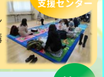
子ども家庭支援センター

お子さんの成長、発達に見合った遊びや言葉がけなどを学ぶ講座でした。お子さんの遊ぶ姿を見ながら先生の話の聞いたり、アドバイスを受けたりしました。連続講座のため参加者同士が顔見知りとなり、和やかな雰囲気となりました。