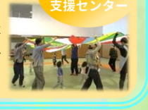
子ども家庭支援センター

江東区スポーツ会館で開催しました。のびのびと身体を動かして、跳んだり走ったり寝転んだり、フープや乗り物にのったり、音楽マット、トンネル、パラバルーンで楽しく遊び、最後は体操をして、さよなら~しました。また次回をお楽しみに!