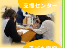
子ども家庭支援センター

当日は民生委員の方にもお手伝いいただき、3つのコーナーを設定しました。折り紙はお母さんも「懐かしい」と楽しんでくれていました。ふくちゃんとおたふくの福笑いは最後に着ぐるみのクマちゃんも登場し、楽しい時間になりました。