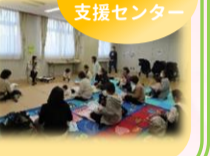
子ども家庭支援センター

ボランティアさんが絵本の選び方のコツや読み方のポイント等を教えてくれました。優しいトーンで実際に絵本を読んでもらったり、なかには涙する方もいました。質問にはご自身のお子さまとのエピソードを交えながらお答えいただき、終始穏やかな時間となりました。