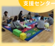
子ども家庭支援センター

3回コース「発達について」「離乳食について」「助産師さんに質問」のテーマで行いました。テーマ以外にも普段の気になる事などをお話しし、なごやかな懇談会となりました。今年度の開催はすみよしつうしんまたはHPをご覧ください。