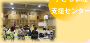
子ども家庭支援センター

おやこコンサートを開催します。ピアノや楽器の音色にあわせて一緒に歌ったりリズム遊びをしましょう！