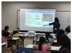
9/25 開催『Chromebook を使って Scratch でゲームを作ろう!』