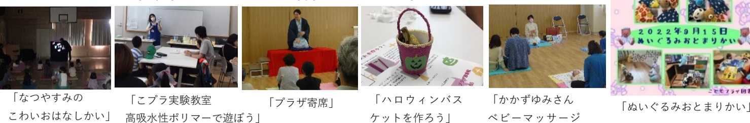
「なつやすみの かわいおはなしかい」