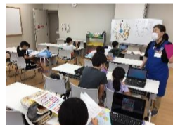
7/17 開催『Chromebook を使って調べてみよう』

こどもプラザには、江東区立の小中学校と義務教育学校の児童・生徒さんに1人1台貸与されている Chromebook 専用の Wi-Fi が整備されています。みなさんの持っている Chromebook をもっと楽しく使ってもらえるように、図書館のシステムを使う講座と、Scratch(スクラッチ)というプログラミングの言語で、かんたんゲームを作る講座を行いました。Chromebook を使った講座は、これからも開催予定です。