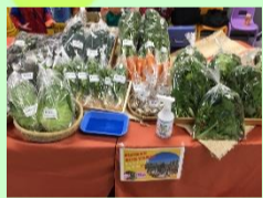
<写真はイメージです>