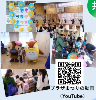
プラザまつりの動画(YouTube)

あいにくの雨天にも関わらず多くの方に来館していただきました(なんと昨年のこどもプラザまつりの2,054人を上回る2,831人が来館!).