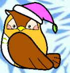
こどもプラザキャラクター「ふくちゃん」