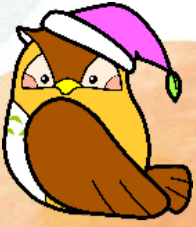
こどもプラザキャラクター 「ふくちゃん」